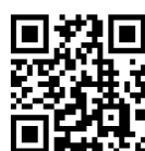
大江ノ郷自然牧場